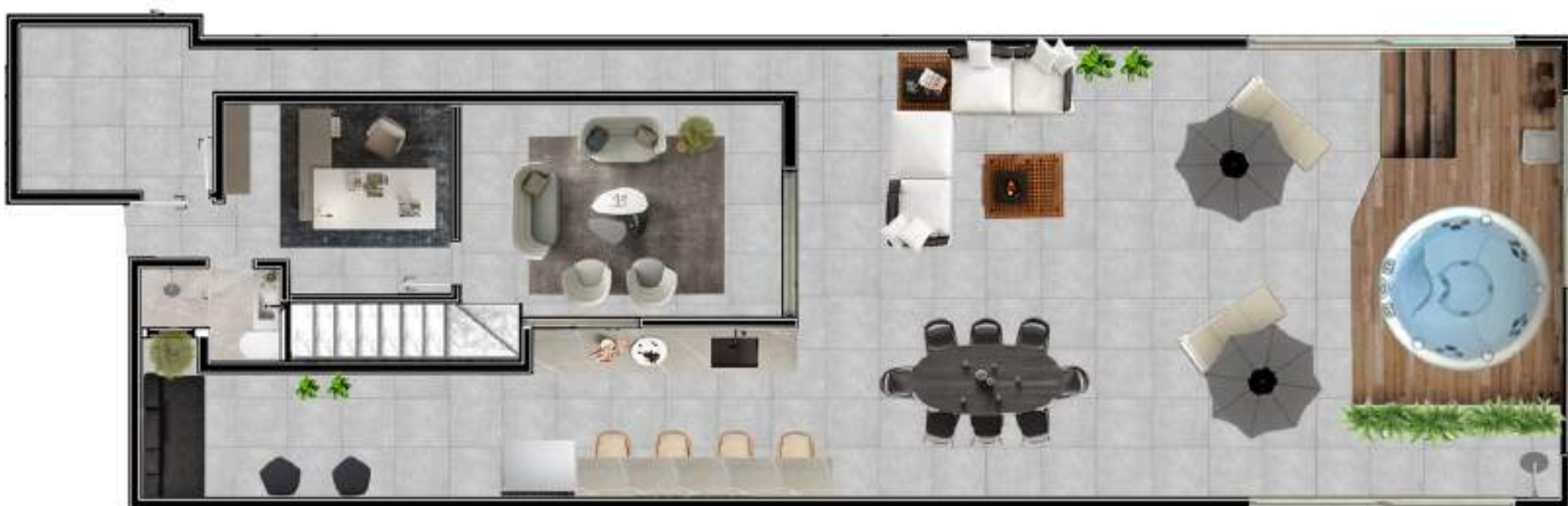
PLANTA 2º ANDAR