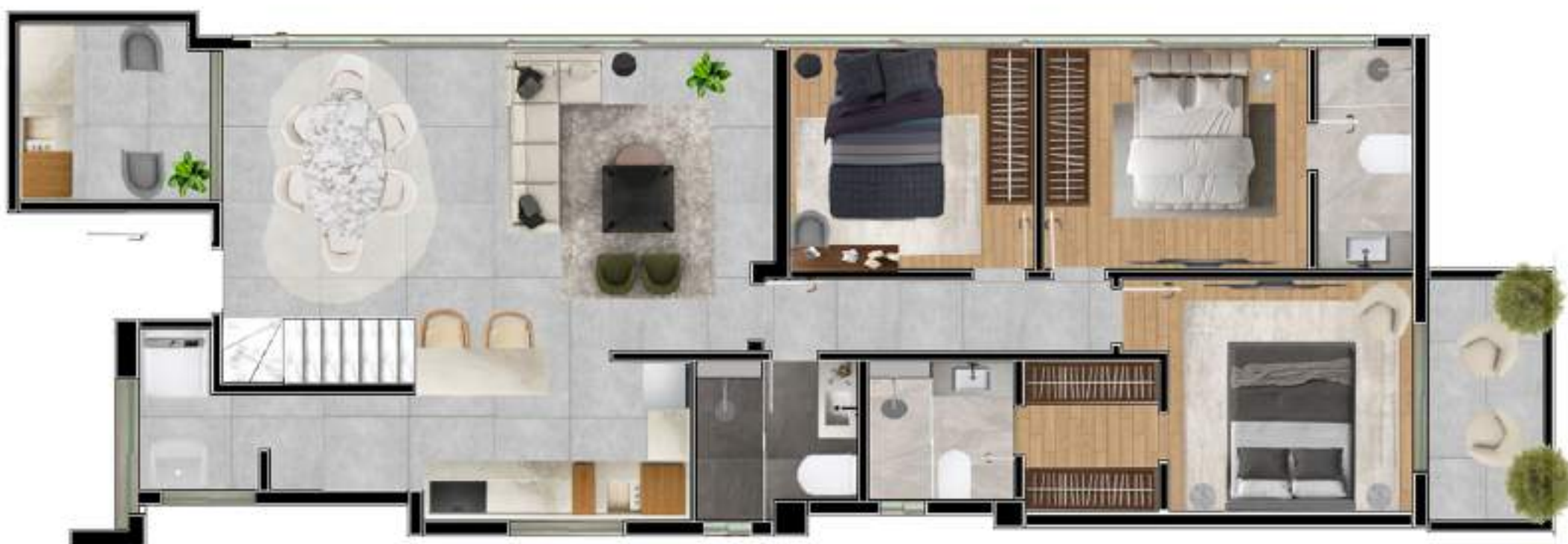
PLANTA 1º ANDAR